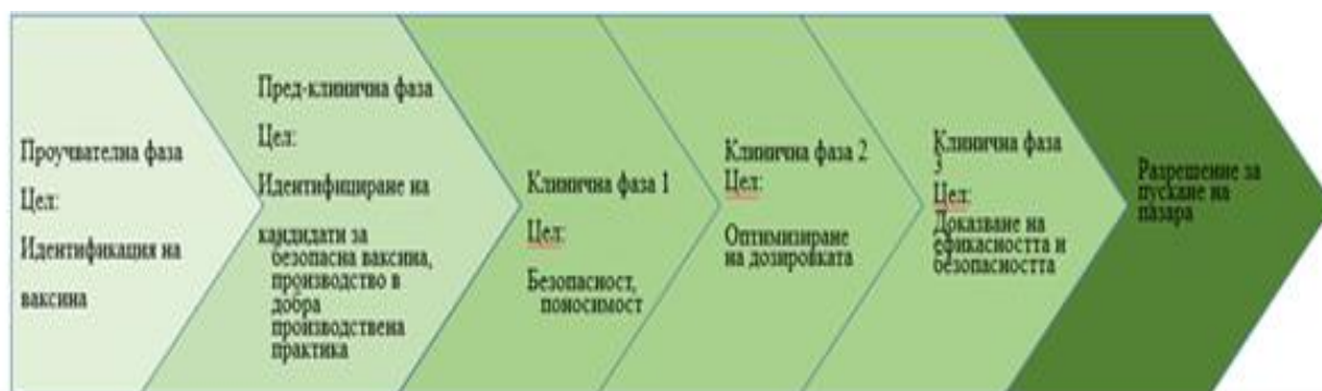
Фигура 1: Общ преглед на фазите на разработване на ваксини

Някои от ваксините се основават на нови технологии така, че да могат да се разработват и произвеждат бързо в условията на пандемия. Ваксините ще се предоставят за употреба само след задълбочена и сериозна оценка за доказване на безопасността им. За да бъдат ефективни обаче повечето ваксини изискват прилагането на две дози.